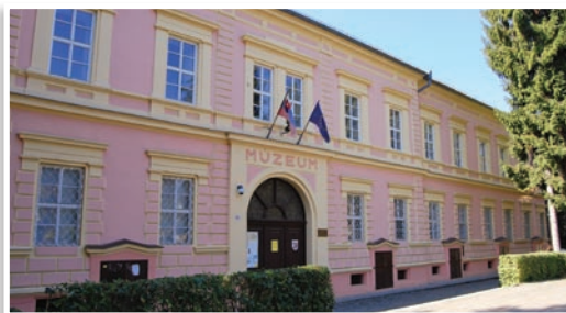
Gemerské múzeum - budova prvého pôsobiska školy (1931-1949)