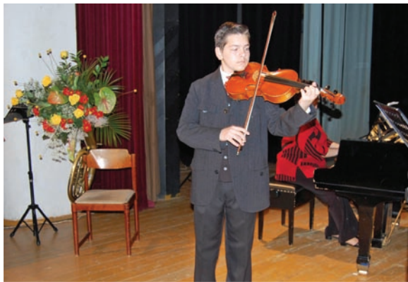
Májový verejný koncert šk. rok 2009/2010