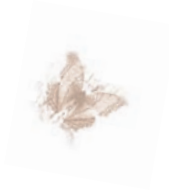
Pódium Mladých Umelcov, Hnúšťa 2011