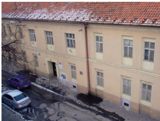
Od roku 1949 sídli škola na Salvovej ulici, kde je dodnes hudobný odbor a riaditeľstvo