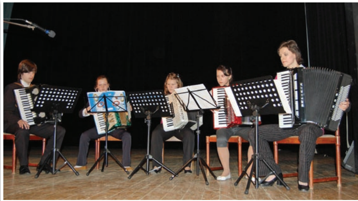
Májový verejný žiacky koncert 2010/2011