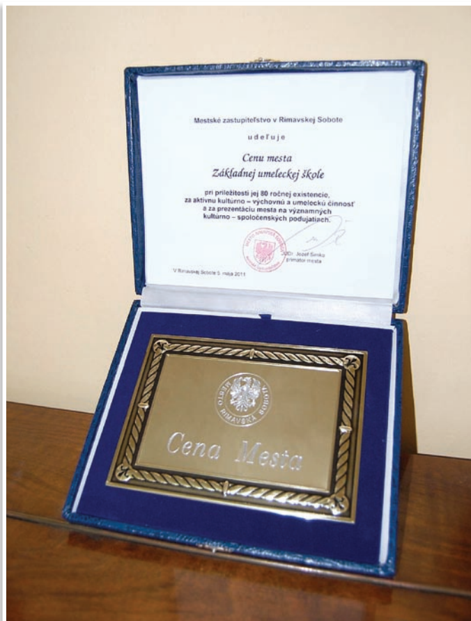
Cena Mesta Rimavská Sobota, ktorú škola dostala pri príležitosti 80. výročia založenia