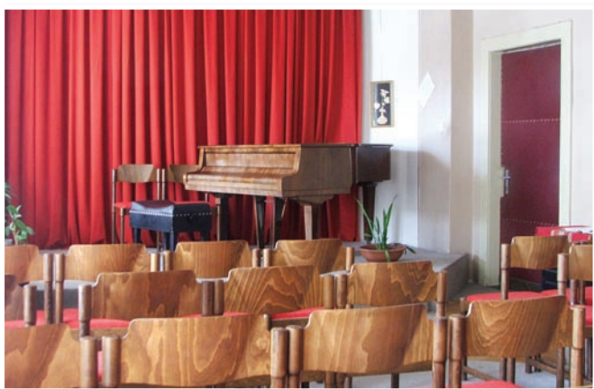
Koncertná sála hudobného odboru

Štúdiom hudobného odboru ponúka príležitosť rozvíjať schopnosti vnímavého žiaka, zabezpečuje dosiahnutie hudobných vedomostí a ich rozvíjanie. Berie do úvahy vekové zvláštnosti, rozširuje vedomosti, rozvíja schopnosti podľa záujmu a nadania žiaka. Zdokonaľuje u dieťaťa jeho prirodzené vlohy, melodické, rytmické, harmonické, intonačné a pamäťové schopnosti. Okrem toho je prínosom aj pre celkový rozvoj osobnosti. Umožňuje vytváranie potrebných zručností pre osvojenie si nástrojovej hry a speváckej techniky.