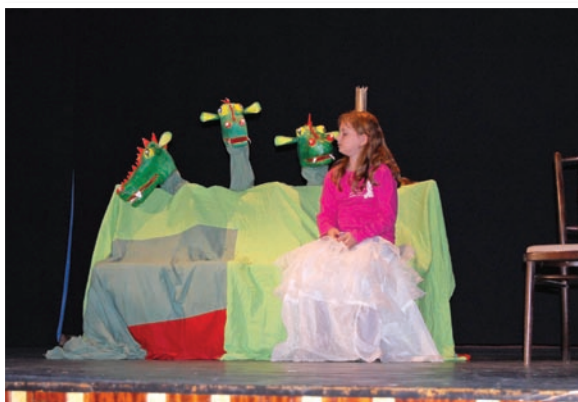
DDS Zauško - „Julinka a drak“ - šk. rok 2010/2011