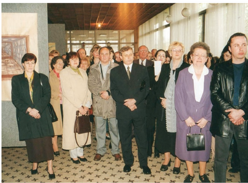
Vernisáž bývalých absolventov výtvarného odboru ZUŠ