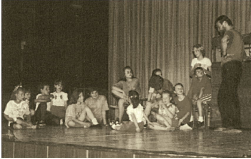
Prvá hra DDS ZAUŠKO "Čarovný kufrik" (1993) (z niekoľkých detí, ktoré hrali v tejto hre sú už dnes profesionálni herci...)