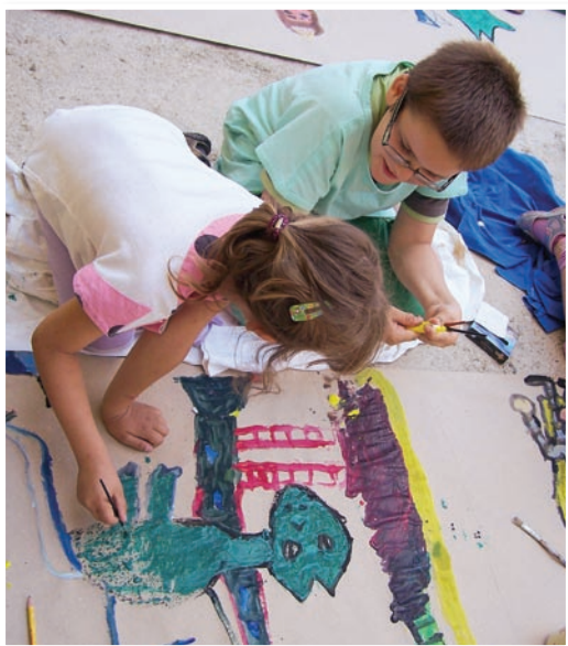
Workshop „Príď a maľuj“ na nádvorí ZUŠ na Svätoplukovej ulici

Výtvarný odbor, založený v roku 1963, je zameraný na rozvoj výtvarného cítenia, videnia, myslenia a tvorivosti. Žiaci základných a stredných škôl svoje výtvarné výpovede vyjadrujú prostredníctvom výtvarného jazyka a techník, ktoré si osvojujú na hodinách kresby, maľby, grafiky, dekoratívnych činností, modelovania a priestorového vytvárania. Okrem klasických techník sa oboznamujú aj s alternatívnymi výtvarnými technikami, zúčastňujú sa workshopov. Vo vyšších ročníkoch sa môžu špecializovať na keramiku, točenie na hrnčiarskom kruhu, tkanie na tkáčskom stave, či základy počítačovej grafiky.