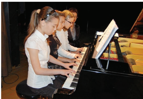
Májový verejný koncert šk. rok 2010/2011