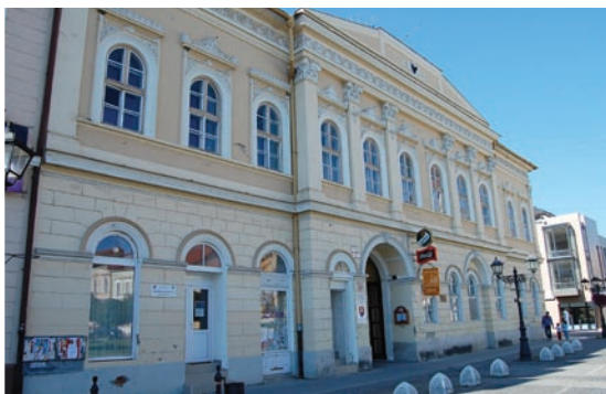
Budova Reduty „Čierny orol”, kde sa v 70.-80.rokoch vyučoval výtvarný odbor