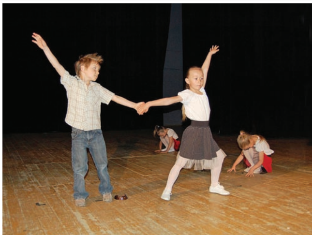
Májový koncert 2011