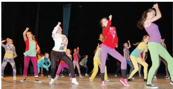
Choreografia TO „Discopribeh“ - šk. rok 2010/2011