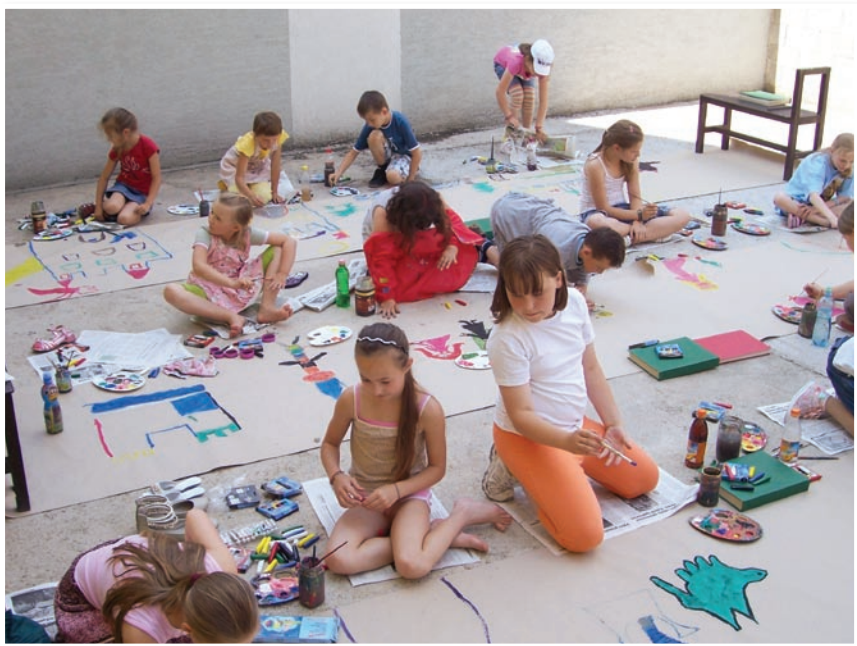
Workshop „Prid' a maluj“