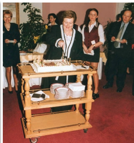
Slávnostná recepcia v priestoroch hotela Zlatý býk