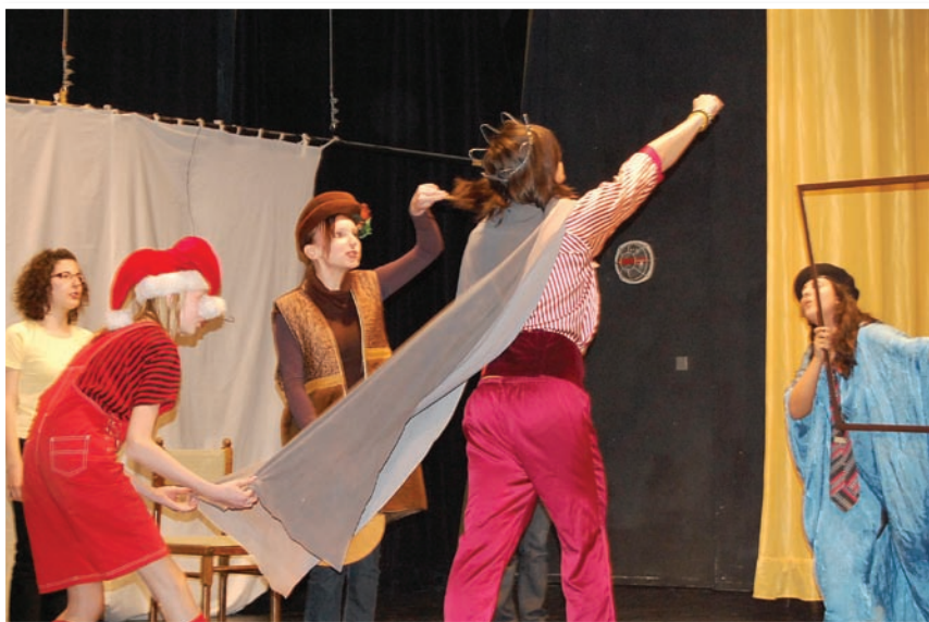
Z inscenácie CISÁROVE NOVÉ ŠATY (DS Alterna, 2009)