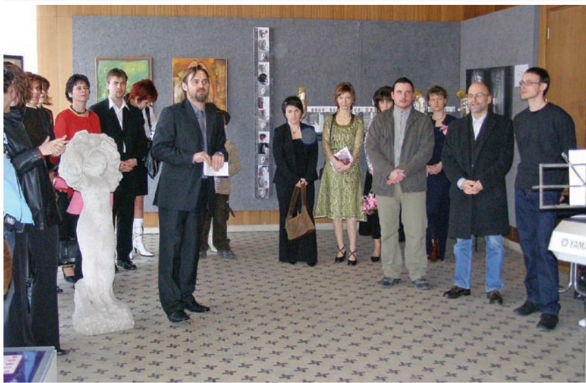
Vernisáž bývalých absolventov výtvarného odboru v galérii Ganevia v MsKS