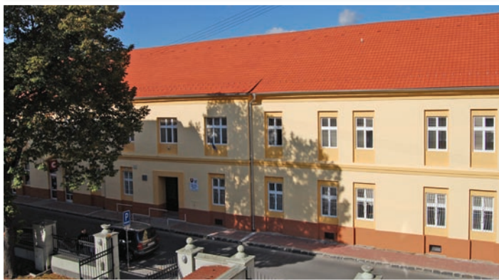
Budova ZUŠ po rekonštrukcii

Začiatok školského roka 2011/2012 sa nesie v znamení rekonštrukcií budovy na Salvovej, aj Svätoplukovej ulici. Na 200 ročnej budove hudobného odboru bola prevedená výmena strechy a oprava čelnej fasády.