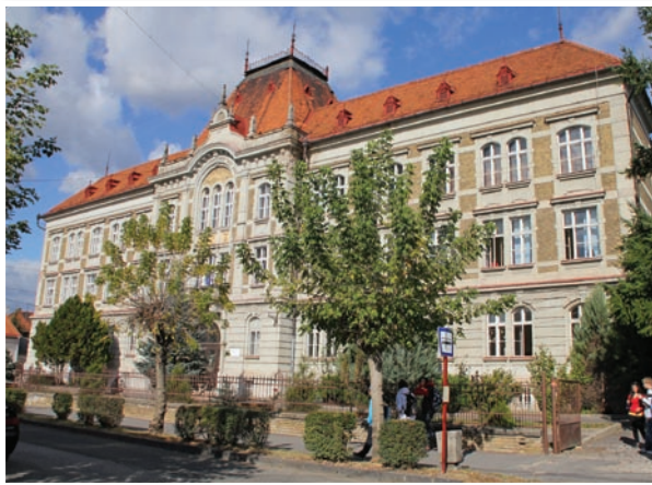
Budova štátneho gymnázia, kde sa od roku 1963 začal vyučovať výtvarný odbor