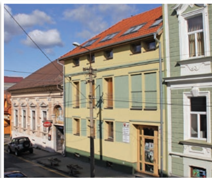
Budova výtvarného odboru po rekonštrukcii