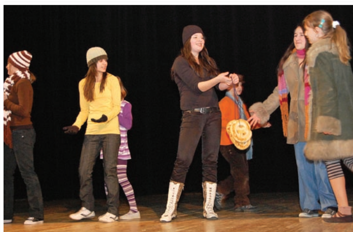
DDS Zauško „Zázračný kvet“ - šk. rok 2009/2010