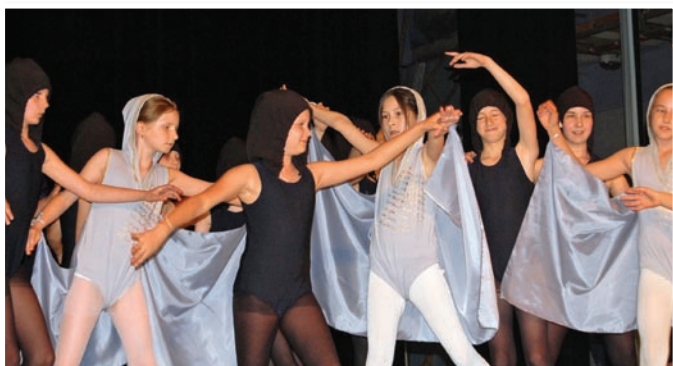
Choreografia TO „Sen“ - šk. rok 2008/2009