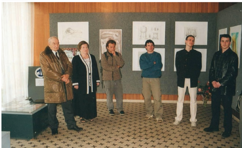
Vernisáž bývalých absolventov výtvarného odboru ZUŠ