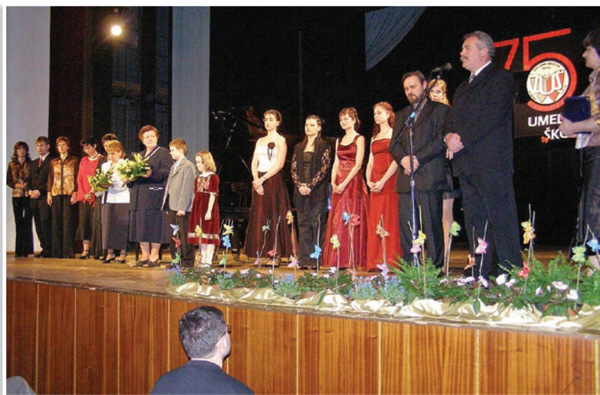
Z osláv 75-teho výročia ZUŠ