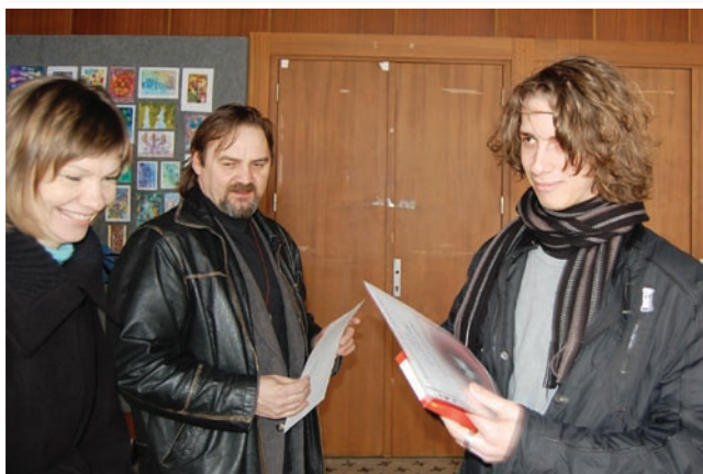
Celoštátna výtvarná súťaž Novoročenky

ZUŠ je spoluorganizátorom medzinárodných umeleckých workshopov – Letavy, spolupracuje aj na príprave workshopov pre deti z detských domovov Konvergencie.