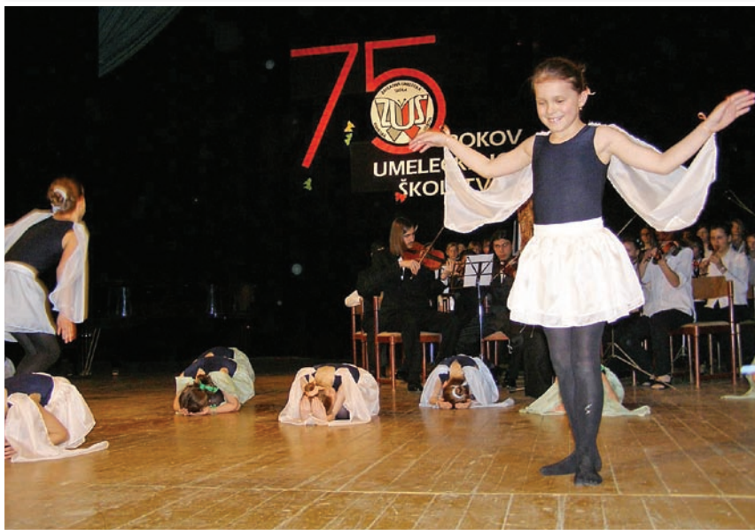
Žiačky tanečného odboru