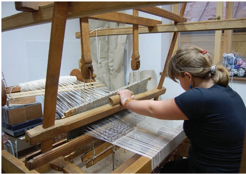
Práca na tkáčskom stave