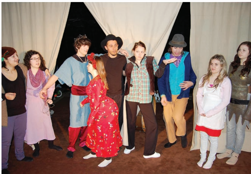
Z inscenácie DLHÝ NOS (DS Alterna, 2010)