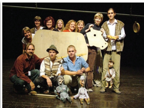
DS Alterna - „Drevená krava“